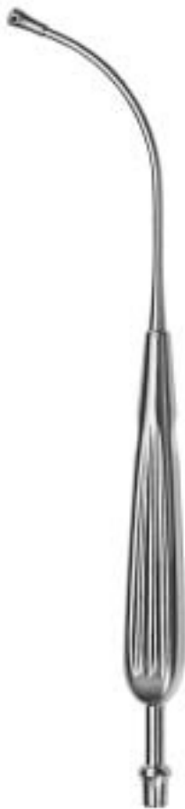
ANDREW-PYNCHON FL-511-24 ø 6 mm (18 Charr.) 23 cm