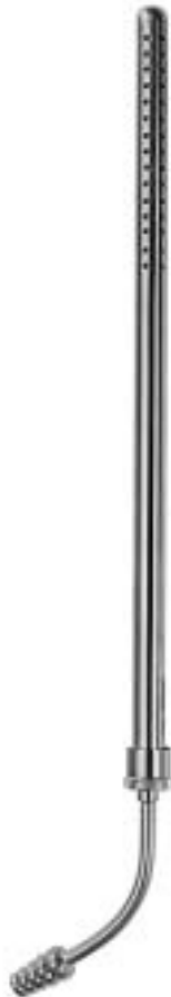
POOLE FL-410-06 ø 6 mm (18 Charr.) FL-410-08 ø 8 mm (23 Charr.)