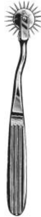
WARTENBERG FL-230-19 19 cm

Nadelrad Pinwheel Algesimetre Rueda de espigas Algesimetro