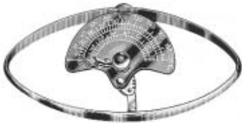
COLLIN FL-410-01 Erwachsene • Adult FL-410-02 Kinder • Child • enfant niños • bambini