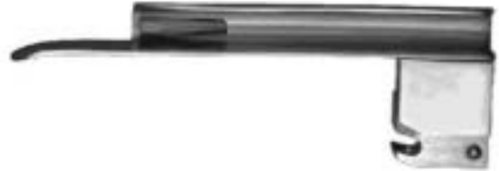
WISCONSIN-HIPPLE Spatel WISCONSIN-HIPPLE Blades

Delta Lite Standard Spatel Sigma Lite conventional blades