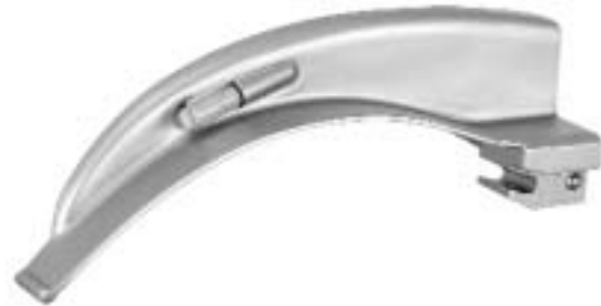
MACINTOSH Spatel mit spezieller Biegung MACINTOSH Blades with special curvature