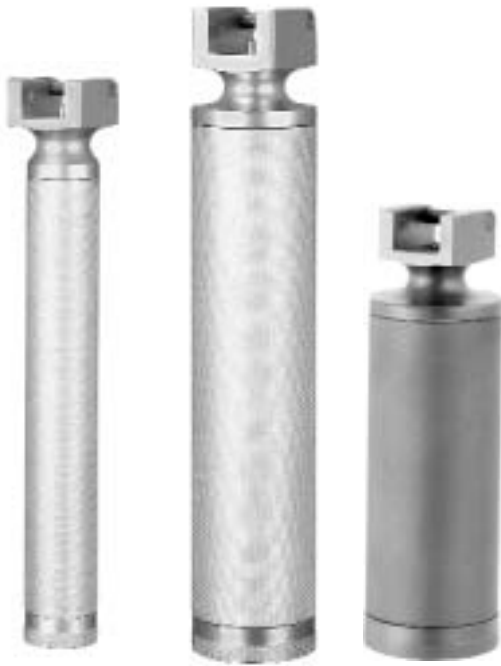
Delta Lite Standard Griffe für Spatel mit spezieller Biegung Sigma Lite conventional handles for blades with special curvature