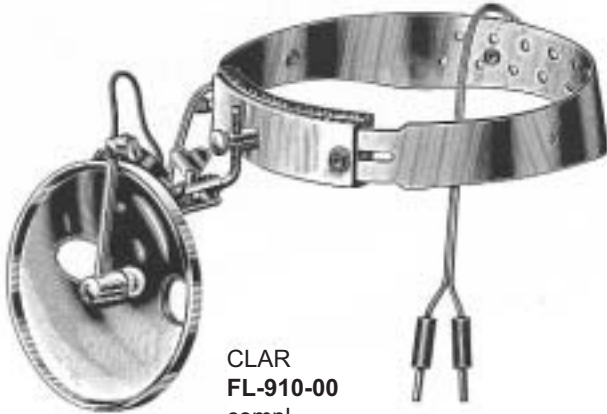
CLAR FL-910-00 compl. 6 V.