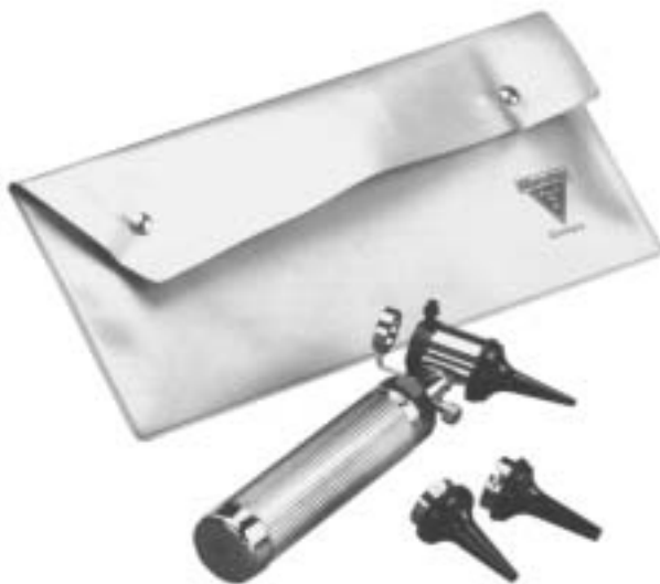
FL-714-00 Otoskop • Ootoscope • Ootoscopio