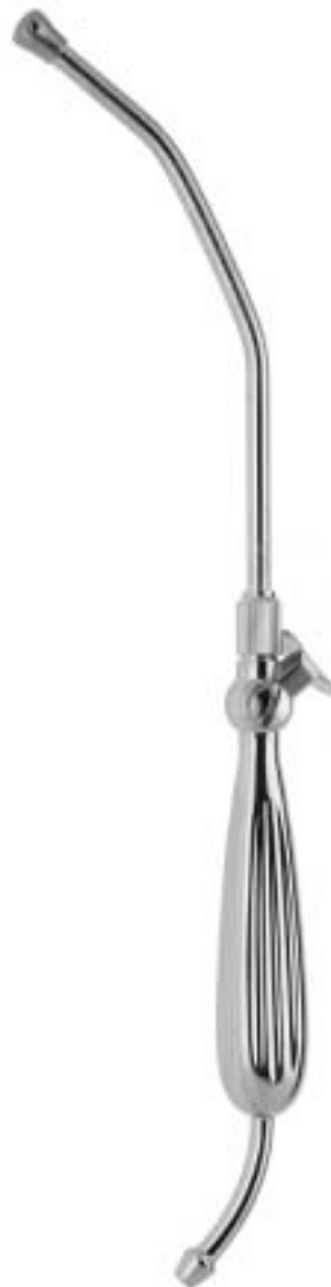
WALTON YANKAUER FL-512-33 ø 10 mm (30 Charr.) 32 cm

mit Absperrventil und abschraubbarem Rohr