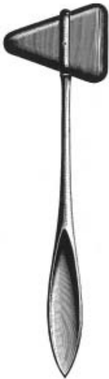
cm TAYLOR 17 FL-828-17 20 FL-828-20