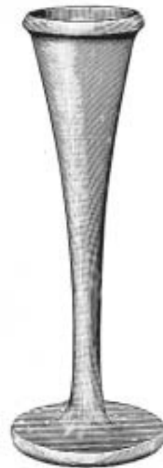
PINARD FL-622-18 18 cm