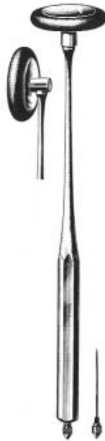
BABINSKY FL-922-22 22 cm