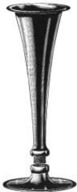
PINARD FL-620-15 15 cm