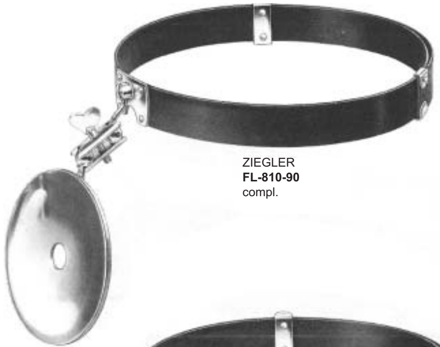
ZIEGLER FL-810-90 compl.