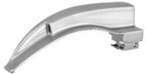
MACINTOSH Spatel mit integriertem Lichtleiteraustritt MACINTOSH Blades with integrated light guide

Sigma Lite Faseroptik Spatel Sigma Lite fibreoptic blades