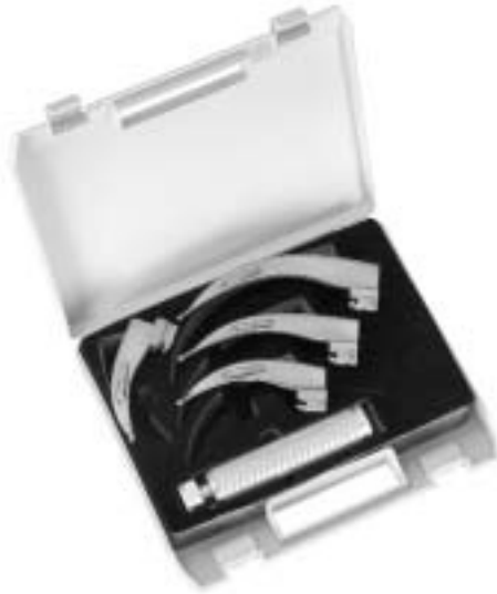
Delta Lite Standard Spatel Sigma Lite conventional blades