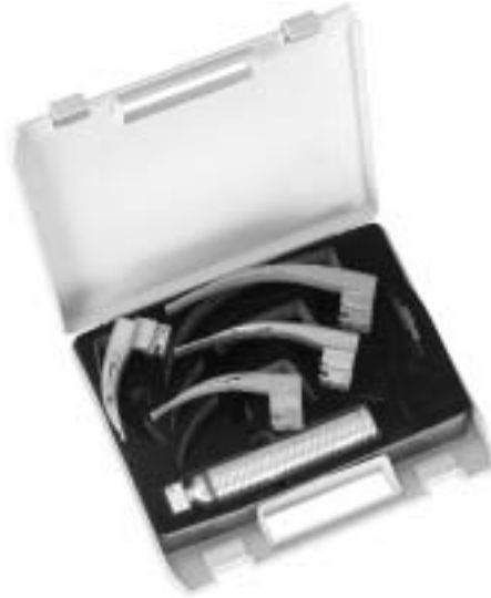
Sigma Lite Faseroptik Spatel mit auswechselbarem Lichtleiter Sigma Lite fibreoptic blades with interchangeable fibreoptic light guide