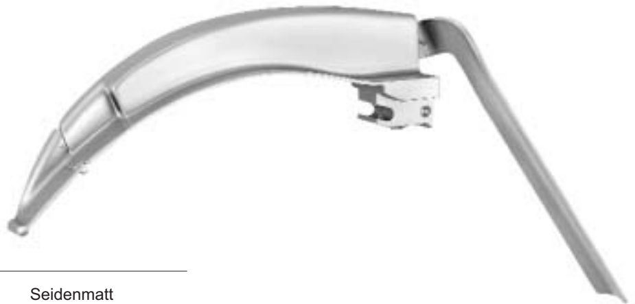
MACINTOSH Spatel mit flexibler Spitze MACINTOSH Blades with flexible tip