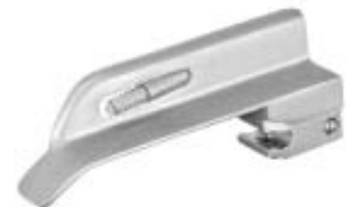
PEDIATRIC Spatel PEDIATRIC Blades