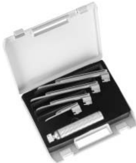
Sigma Lite Faseroptik Spatel mit auswechselbarem Lichtleiter Sigma Lite fibreoptic blades with interchangeable fibreoptic light guide