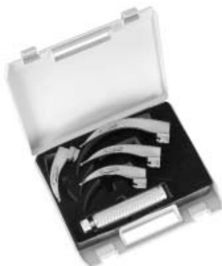
Delta Lite Standard Spatel Sigma Lite conventional blades