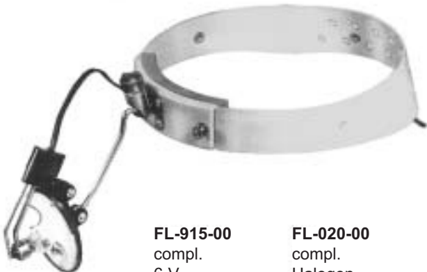
FL-915-00 compl. 6 V.