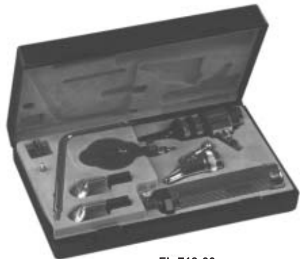
FL-713-00 Econom Universal