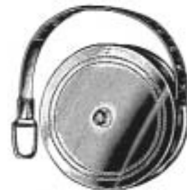
FL-530-15 1,5 m

Maßband, Stahl Tape measure, steel Ruban métrique en acier Cinta métrica de acero Nastro metrico di acciaio