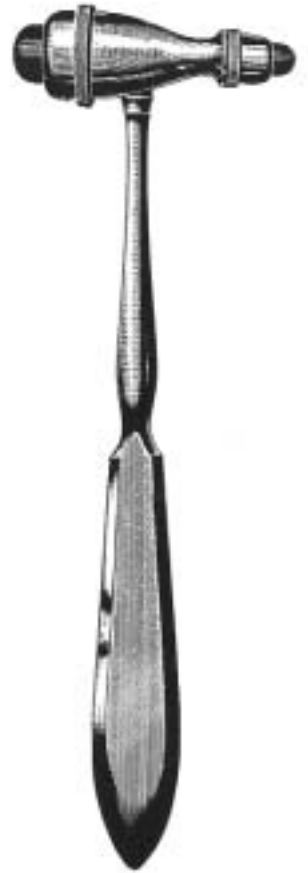
TROEMNER FL-924-24 24 cm