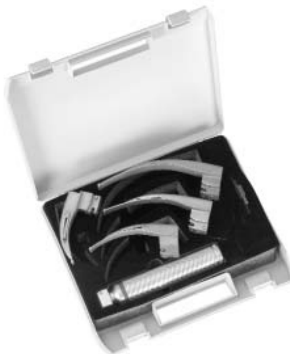
Sigma Lite Faseroptik Spatel Sigma Lite fibreoptic blades